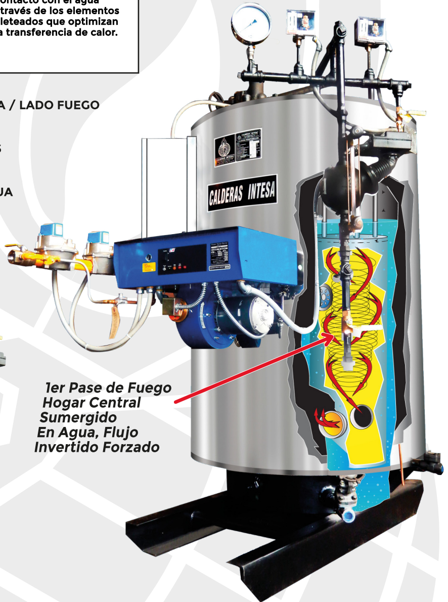
1er Pase de Fuego Hogar Central Sumergido En Agua, Flujo Invertido Forzado