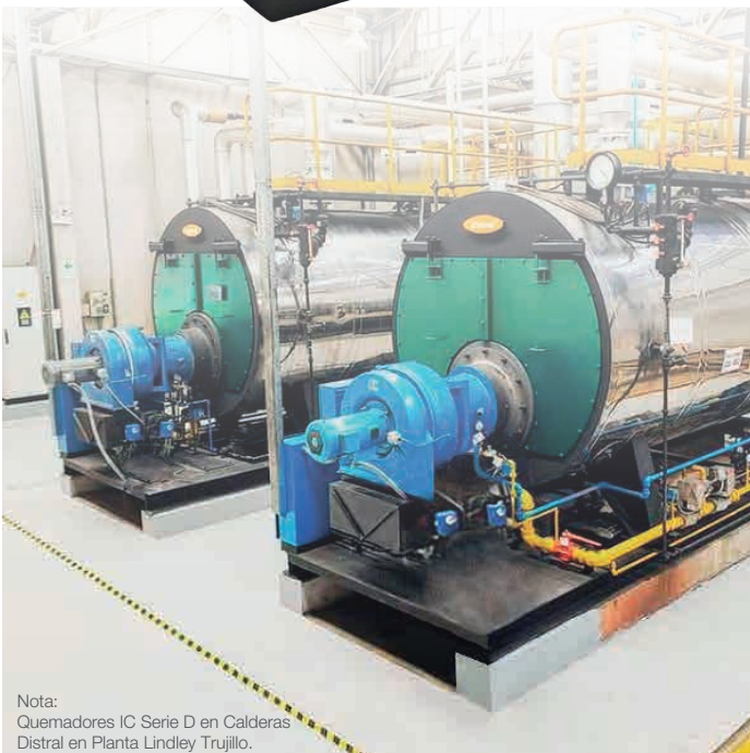
Nota: Quemadores IC Serie D en Calderas Distral en Planta Lindley Trujillo.